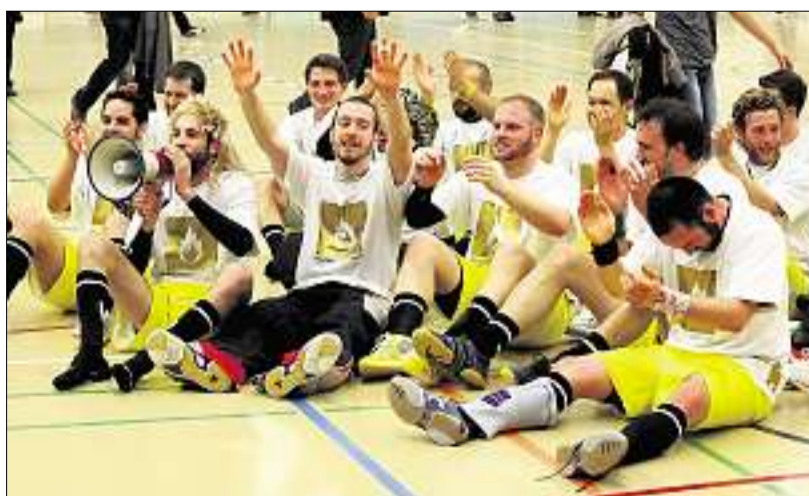
Die Spieler der Jona-Uznach Flames feiern ihre Rückkehr in die NLB. (Stefan Kleiser)

Vor der Jubelorgie mussten die St. Galler allerdings hartes Brot essen. Im Gegensatz zum ersten Spiel in Jona